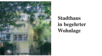
Stadthaus in begehrter Wohnlage

Frankfurt-Dichterviertel: Top Villenlage, stilvolle ETWs, ab 120-255 m 2 , exzellente Ausstattung, hohe Decken, Premium-Parkett, große Balkone, EG zusätzlich mit eig. Südwest-Garten, Tiefgarage, ab 481.000,- € provisionsfrei